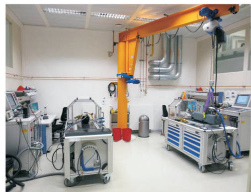
Neuer Motorenprüf- und Reparaturplatz

Daraus ergibt sich für Sie eine verbesserte Preisattraktivität und kurze Reaktionszeiten im Servicefall.